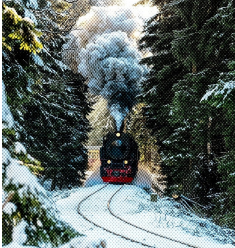
LE BORÉAL EXPRESS POLAR EXPRESS

We have three exquisite packages to choose from :