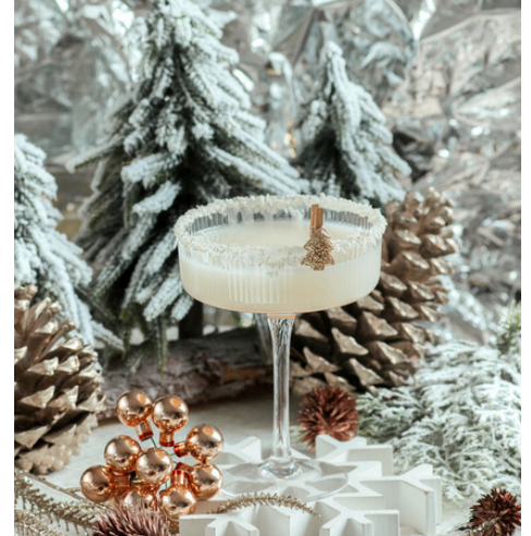
NOËL BLANC WHITE CHRISTMAS