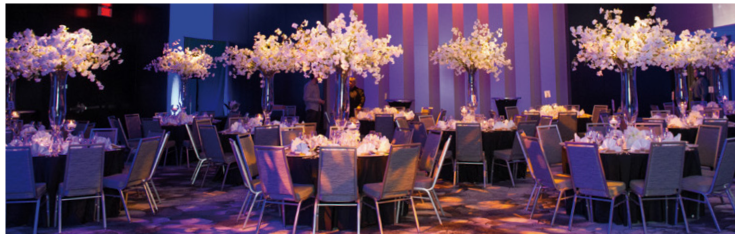
Le salon A. & S. Nordheimer